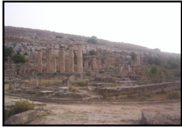
شكل رقم (4)