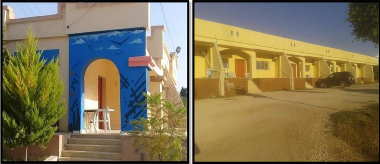
شكل رقم (7) منتجع شحات