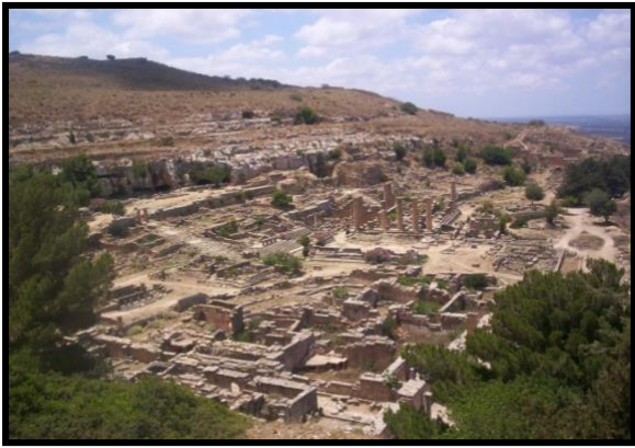
شكل رقم (5)