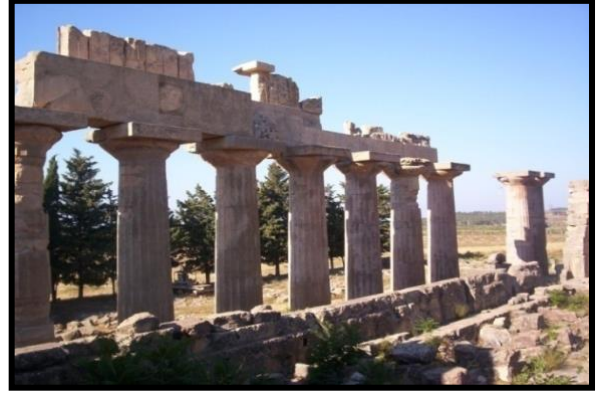
شكل رقم (2)