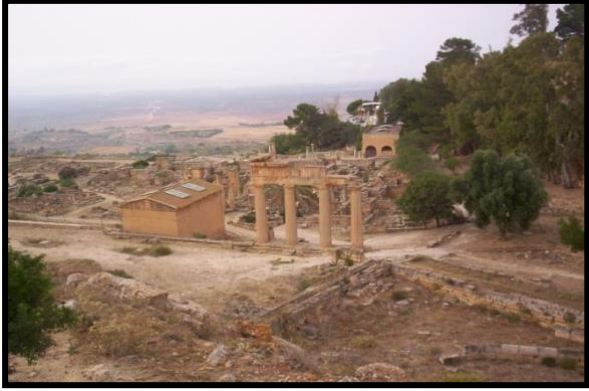
شكل رقم (3)

كما أصبحت مدينه قورينا اكبر واجمل مدن العالم تليها في ذلك مدينه أثينا (صفى الدين، 2005، 127) الاشكال (2، 3، 4، و 5) توضح بعض أجزاء من آثار شحات.